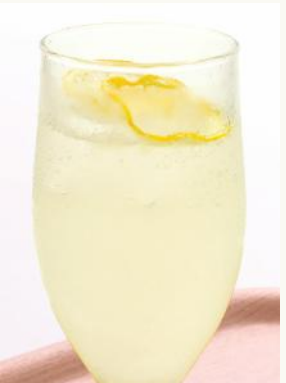
生しぼりレモンスカッシュ ¥ 600