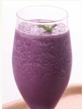
ブルーベリーフローズスムージー ¥ 600