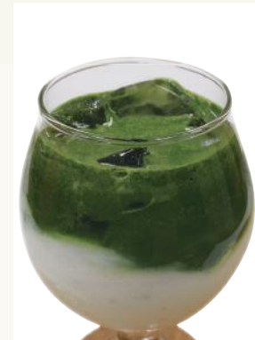
お抹茶ラテ ¥ 600