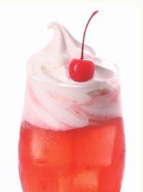
SHINWAフロート 夕陽 (ミックスベリー風味) ¥ 800