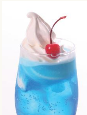
SHINWAフロート 海 (柑橘系風味) ¥ 800