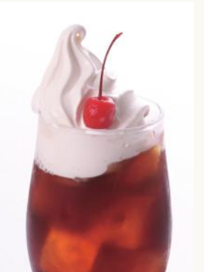
SHINWAフロート コーヒー ¥ 800