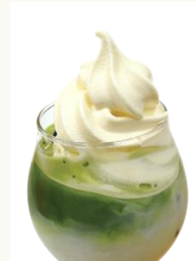
SHINWAフロート 抹茶 ¥ 800