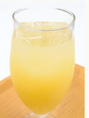
100%りんごジュース ¥ 500